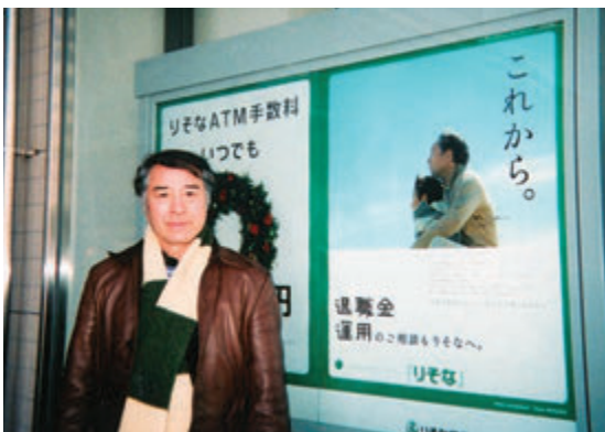
りそな銀行のポスター (孫を抱いてるのが私です)

A 私は未経験のものにチャレンジしたり、知識を得る事に興味があります。今皆さんが学んでいる事全て、人生の進むべき道に役立つ事だと思っています。好きな事が合っているとかが、収入に繋がるとかないかも知れませんが、恐れず勇気を持ってチャレンジして下さい。ダメなら次行ってみよう。世界に一人しか居ない君自身のために!!