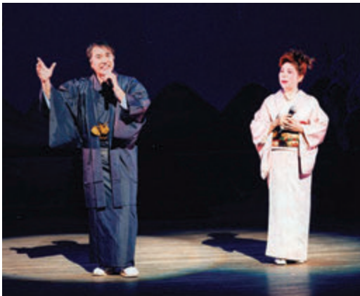
時代劇の舞台出演

A 学んだ事は書ききれない程沢山ありますし、今も修行中です。俳優もモデルも役者(舞台)も、プロダクション等に入りオーディションを受けます。そこで選んでもらって、初めて仕事になります。毎日が様々なオファーに対応出来るよう努力する事と、健康管理も怠ってはいけないし、メンタル面の修行も必要だと思います。日々学んであります。