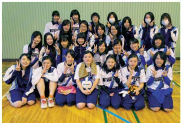
ドッジボール優勝後に笑顔でピース

という気持ちでクラス一丸となり頑張りました。進路が決まっていなくても数人でしたが、そんな中でも自主練をしたり、体育の時間も練習に励んでいました。結果は、ドッジボールで優勝しました。あんなにも必死に頑張ったのはいい思い出です。