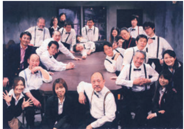
「十二人の怒れる男達」の舞台出演