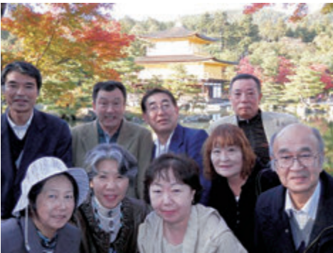
金閣寺をバックに(気分は高校時代そのまま)

京都では、金閣寺や清水寺などを見学し、高校時代にタイムスリップしたような懐かしさを感じました。また、京料理をいただくながら、高校時代の話に花が咲くなど、仲間と有意義な時間を共有でき感謝しています。「友は一生の宝」です。